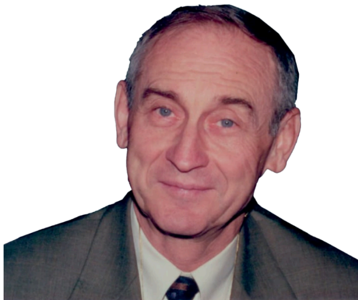
професора Георгія Миколайовича Драніка (1941–2024)